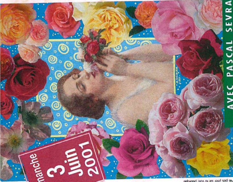
Ne pas jeter sur la voie publique